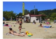
BASE DE LOISIRS